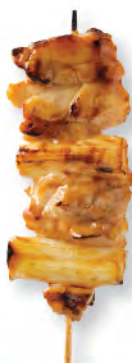
ねぎま 雞肉大葱 Chicken with Leek