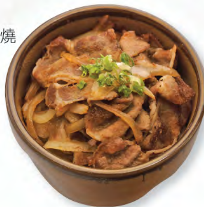
豚肉生姜焼井 黒豚肉生薑燒飯 Japanese Pork with Ginger Sauce Donburi