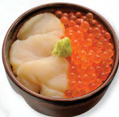
北海道ホタテクラ井 北海道帶子日本三文魚籽飯 Scallop & Salmon Roe Donburi