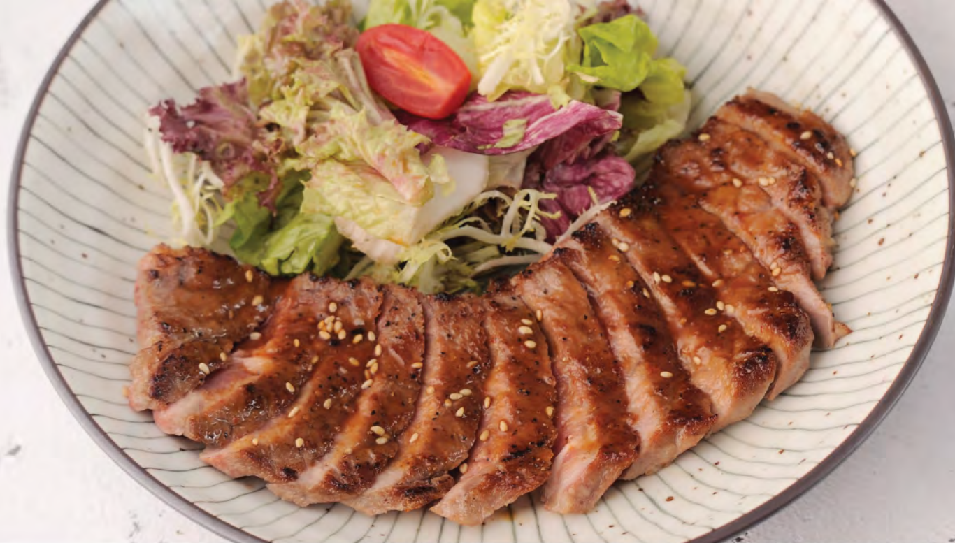
黑毛和牛照焼き御膳 $308 照焼黒毛和牛御膳 (約110g) Japanese Wagyu Beef Steak (approx, 110g)