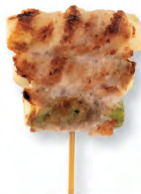
アスパラの 豚肉巻き 日本黒豚露筍 Japanese Pork with Asparagus