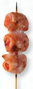
トマトの ベーコン巻き 煙肉番茄卷 Bacon with Cherry Tomato