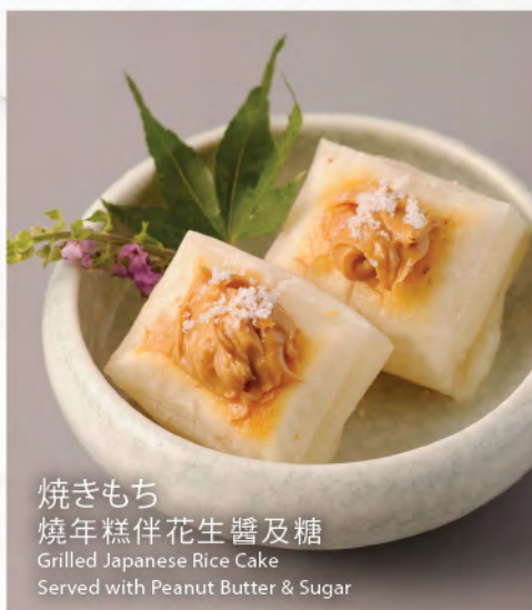
焼きもち 焼年糕 伴花生醬及糖 Grilled Japanese Rice Cake Served with Peanut Butter & Sugar