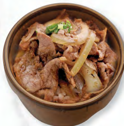
牛井 汁燒牛肉飯 Grilled Beef Slice Donburi