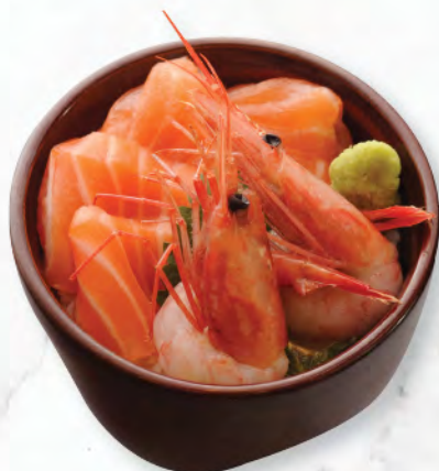
サーモンと甘えび丼 三文魚甜蝦飯 Salmon and Sweet Shrimp Donburi