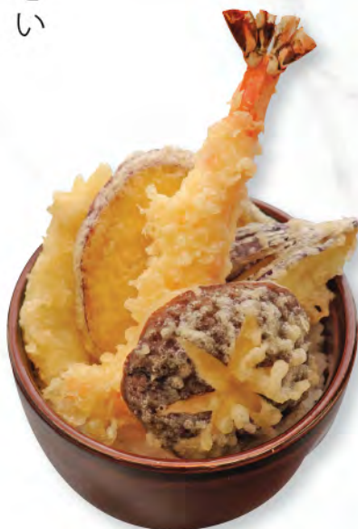
天井 天扶良飯 Tempura Donburi