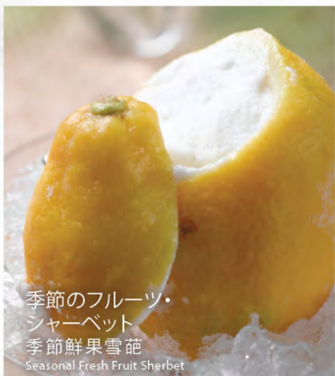
季節のフルーツ・ シャーベット 季節鮮果雪葩 Seasonal Fresh Fruit Sherbet