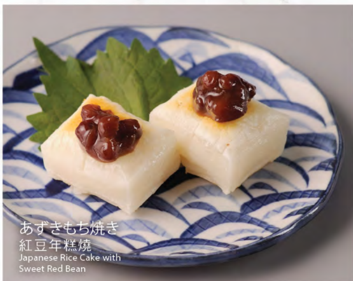
あずきもち焼き 紅豆年糕焼 Japanese Rice Cake with Sweet Red Bean