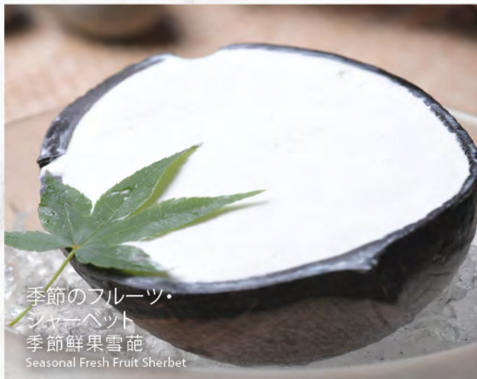
季節のフルーツ・ シャーベット 季節鮮果雪葩 Seasonal Fresh Fruit Sherbet