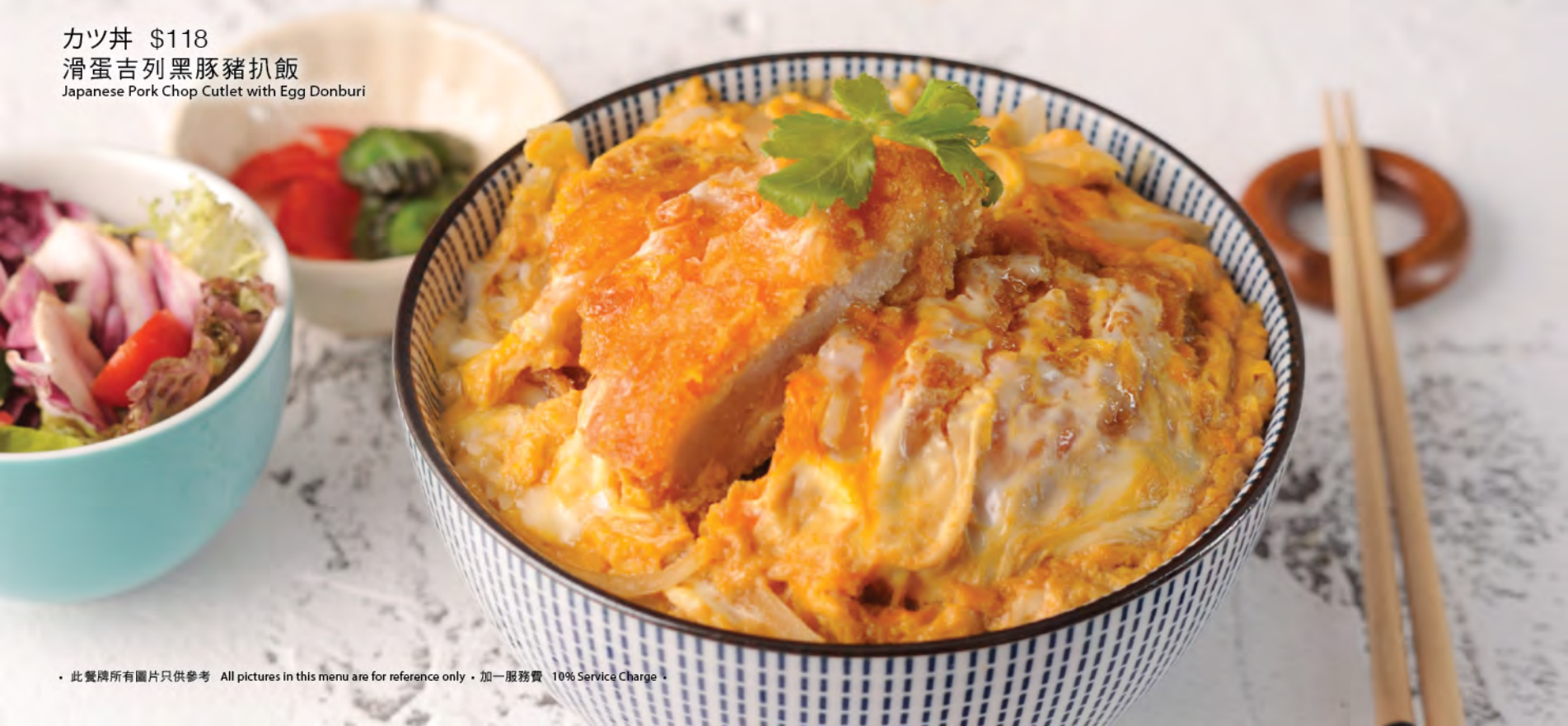
Japanese Pork Chop Cutlet with Egg Donburi