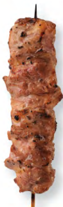
牛リブ 牛肋骨肉 Rib Finger Meat