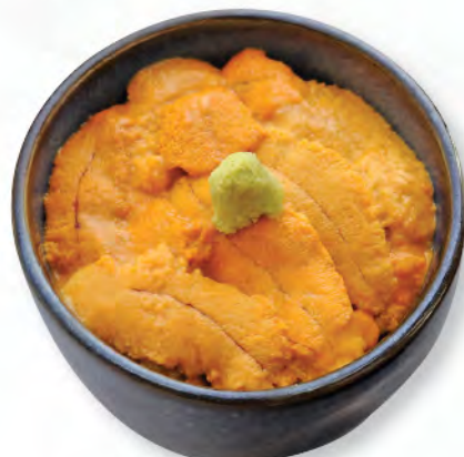
カナダ産うに井 加拿大海膽飯 Canadian Sea Urchin Donburi