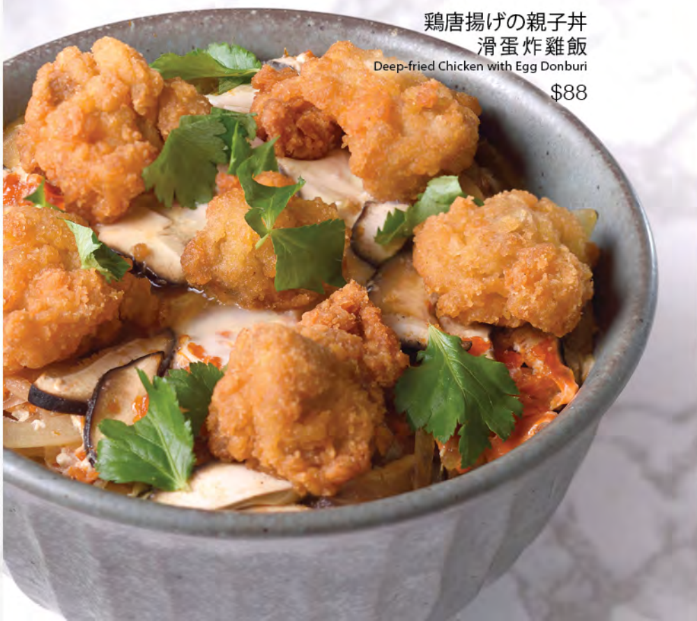
鶏唐揚げの親子丼 滑蛋炸雞飯 Deep-fried Chicken with Egg Donburi $88