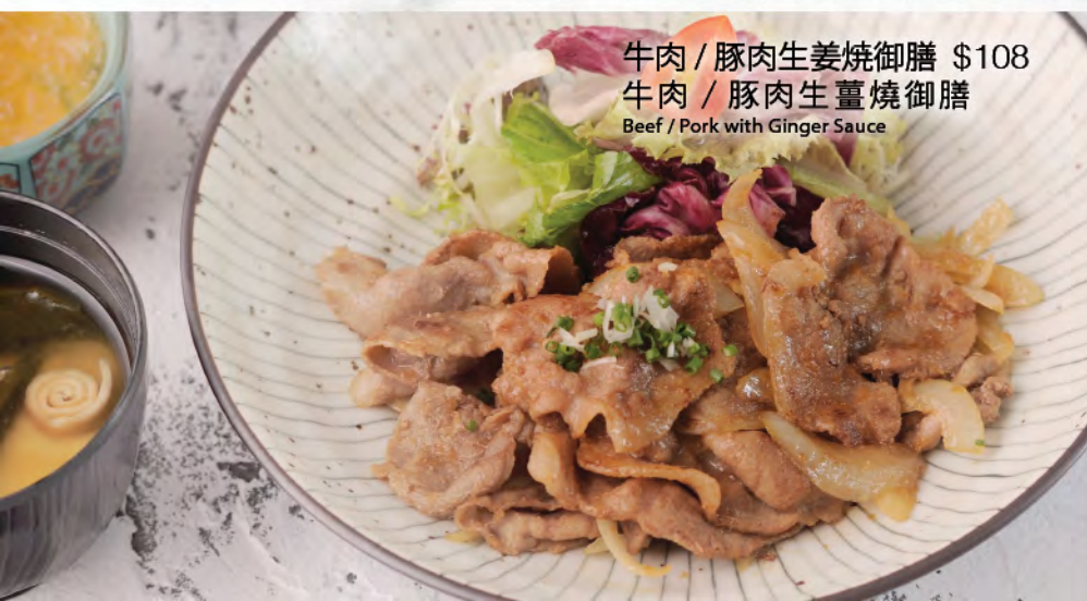
牛肉 / 豚肉生姜焼御膳 $108 牛肉 / 豚肉生薑燒御膳 Beef / Pork with Ginger Sauce