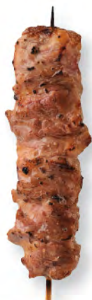
牛リブ 牛肋骨肉 Rib Finger Meat

サラダ・小鉢・温うどん/そば・デザート Salad, Appetizer, Hot Udon or Soba, Dessert 配沙律、前菜、熱烏冬或蕎麥麵、甜品