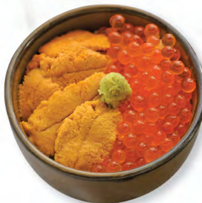
カナダ産うにイクラ井 加拿大海膽日本三文魚籽飯 Canadian Sea Urchin & Salmon Roe Donburi