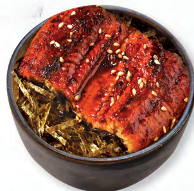
うな井 鰻魚飯 Roasted Eel Donburi