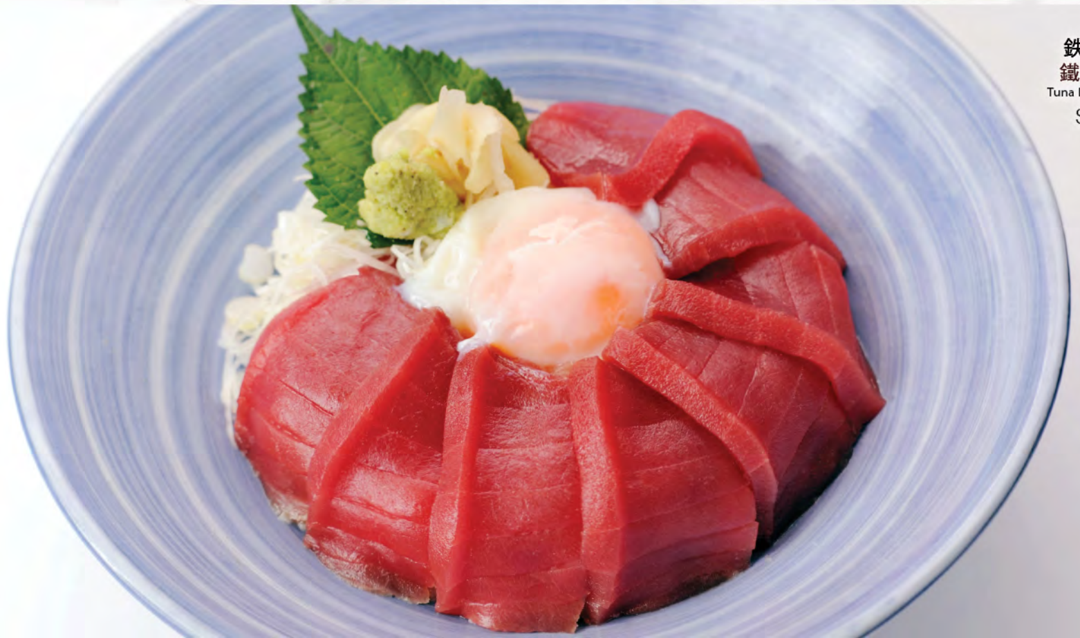
鉄火丼 鐵火丼 Tuna Donburi $188