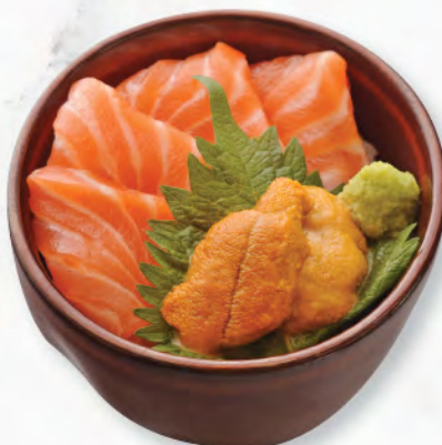
サーモンとうに丼 海膽三文魚飯 Sea Urchin and Salmon Donburi