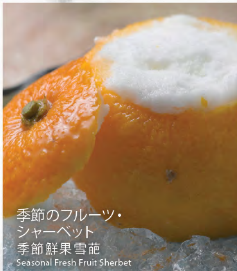
季節のフルーツ・ シャーベット 季節鮮果雪葩 Seasonal Fresh Fruit Sherbet