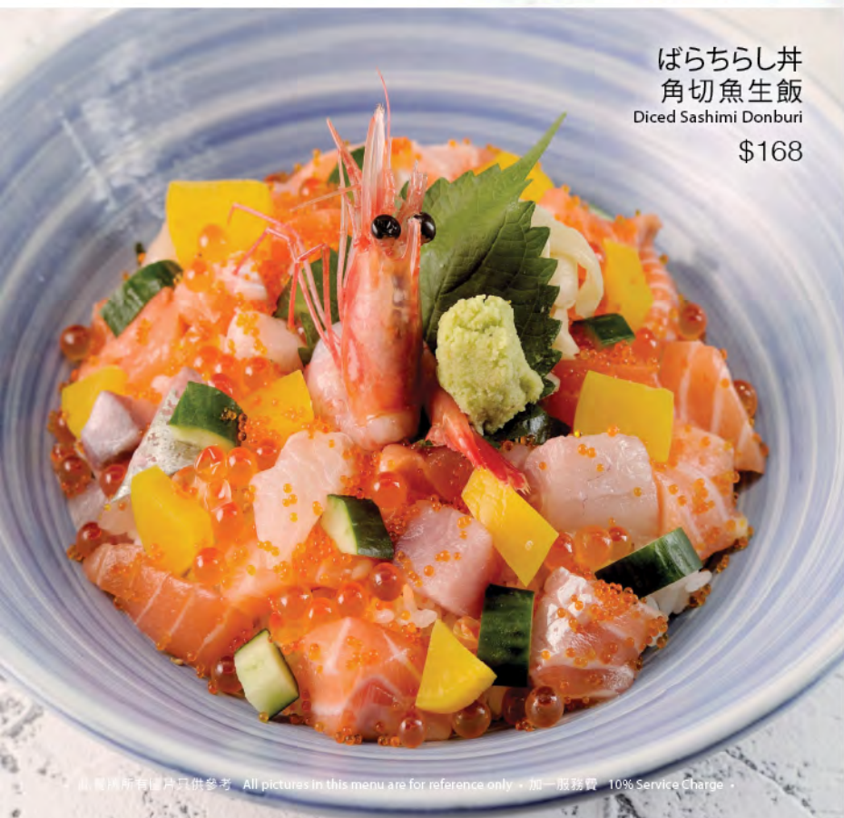
ばらちらし丼 角切魚生飯 Diced Sashimi Donburi $168