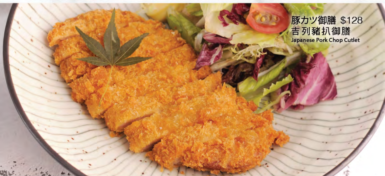
豚カツ御膳 $128 吉列猪扒御膳 Japanese Pork Chop Cutlet