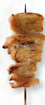
豚バラ 日本黒豚 五花腩肉 Japanese Pork Belly