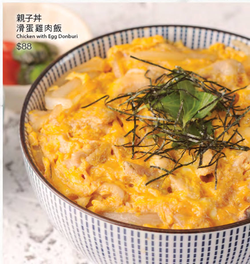
親子丼 滑蛋雞肉飯 Chicken with Egg Donburi $88