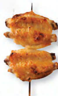
手羽中 燒雞翼 Chicken Wing