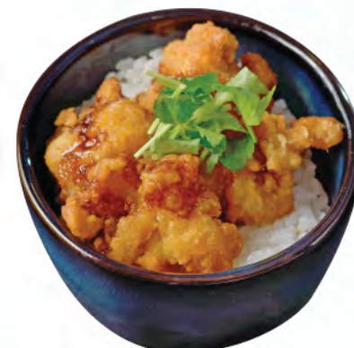
若鷄唐揚げ井 日式炸雞飯 Deep Fried Chicken Donburi