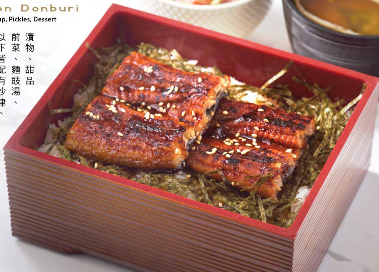
うな重 $118 鰻魚飯 Eel Rice

漬物、甜品 前菜、麵鼓湯、 以下皆配有沙律、 デザート 味噌汁・香の物・ サラダ・小鉢・