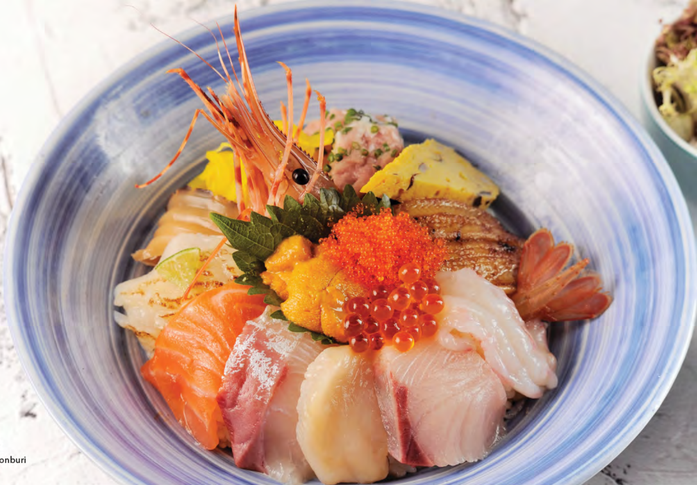
$178 ちらし丼 雜錦魚生飯 Assorted Sashimi Donburi