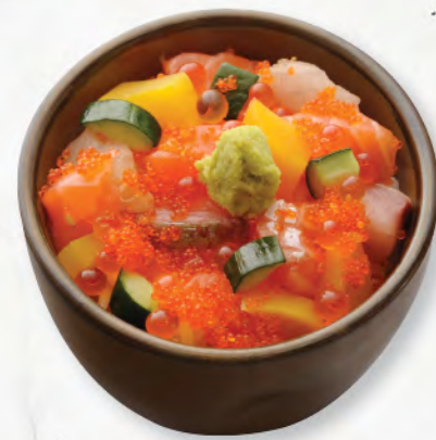
ばらちらし丼 雜錦魚生飯 Assorted Sashimi Donburi