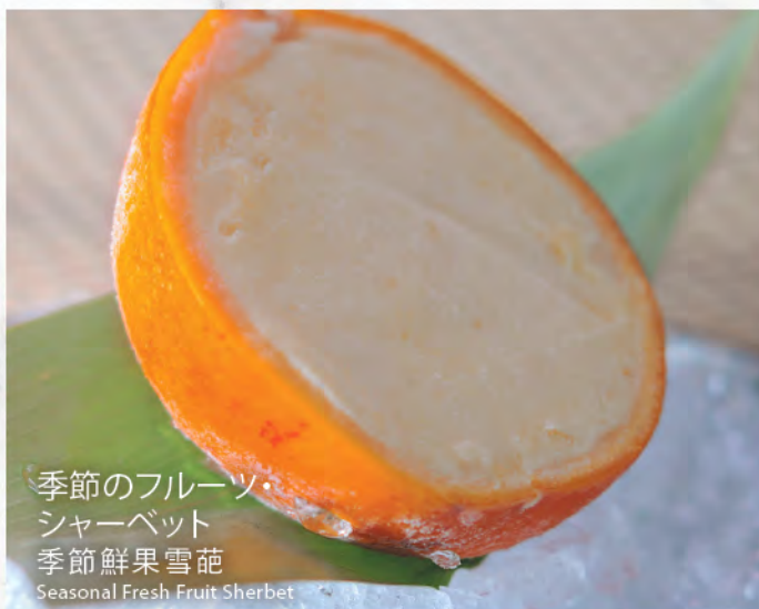
季節のフルーツ・ シャーベット 季節鮮果雪葩 Seasonal Fresh Fruit Sherbet