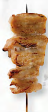
豚バラ 日本黒豚 五花腩肉 Japanese Pork Belly