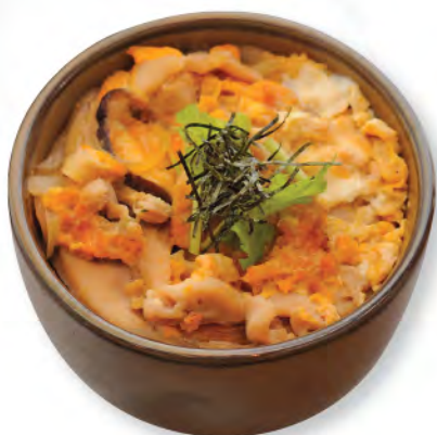
親子井 滑蛋雞肉飯 Chicken with Egg Donburi