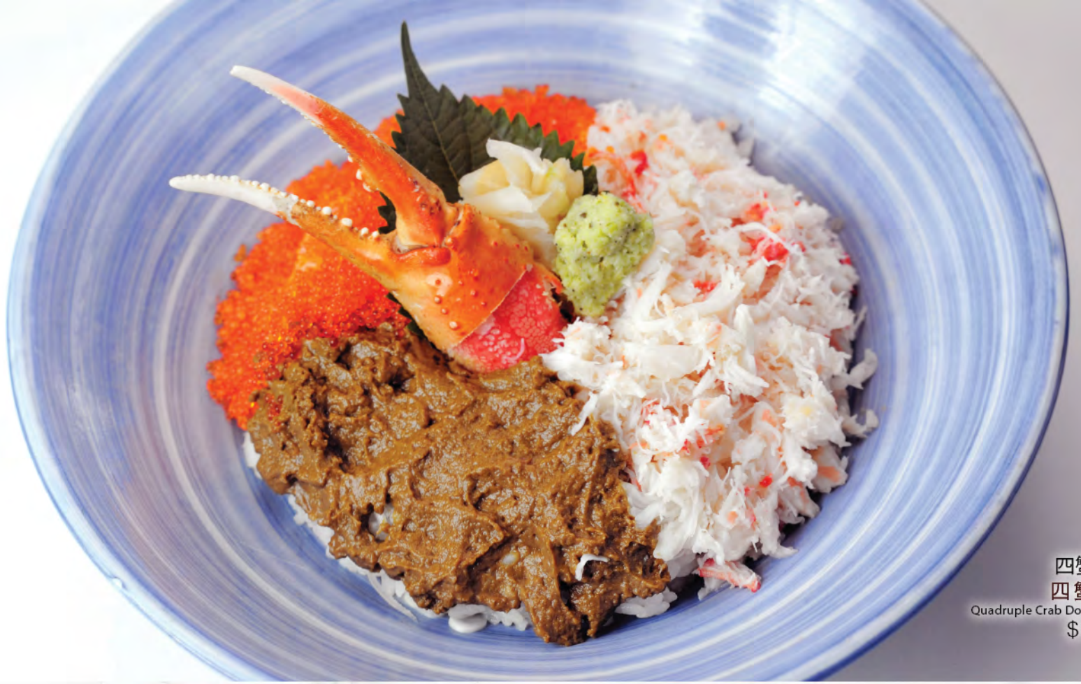
四蟹丼 四蟹丼 Quadruple Crab Donburi $188