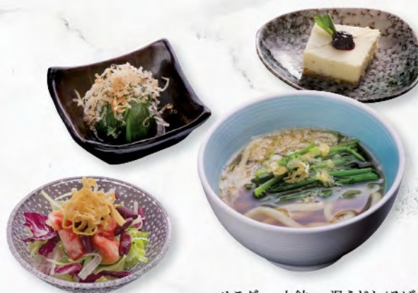
サラダ・小鉢・温うどん/そば・デザート Salad, Appetizer, Hot Udon or Soba, Dessert 以上皆配沙律、前菜、熱烏冬或蕎麥麵、甜品