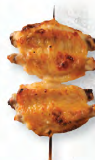
手羽中 燒雞翼 Chicken Wing