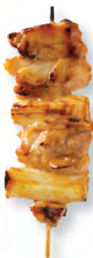
ねぎま 雞肉大葱 Chicken with Leek