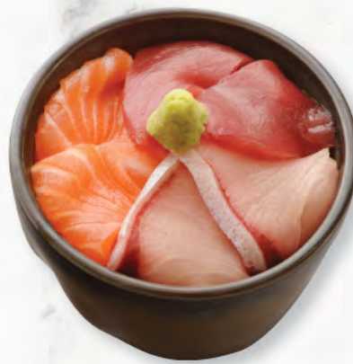
三色丼 三色魚生飯 Salmon, Tuna & Snapper Donburi