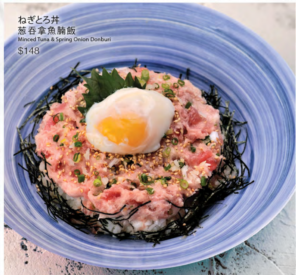
ねぎとろ丼 葱吞拿魚腩飯 Minced Tuna & Spring Onion Donburi $148