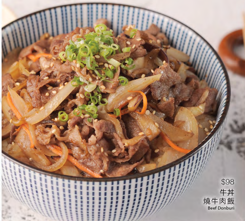
$98 牛井 焼牛肉飯 Beef Donburi