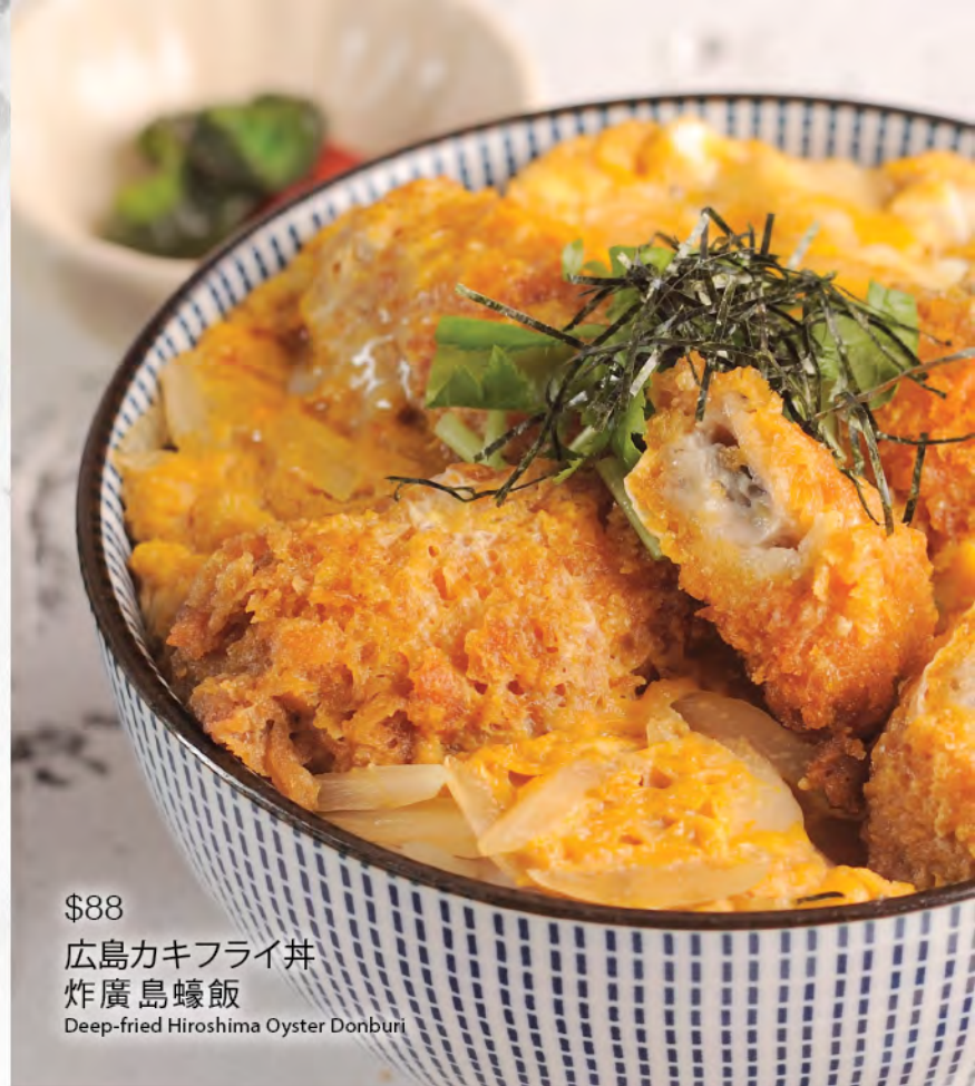
$88 広島カキフライ丼 炸廣島蠔飯 Deep-fried Hiroshima Oyster Donburi