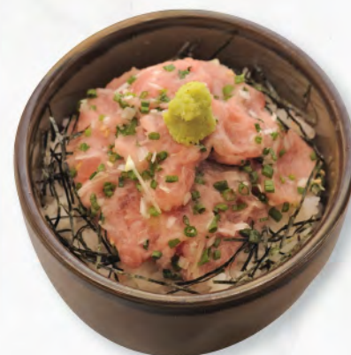
ねぎとろ丼 蔥吞拿魚生飯 Minced Tuna & Spring Onion Donburi