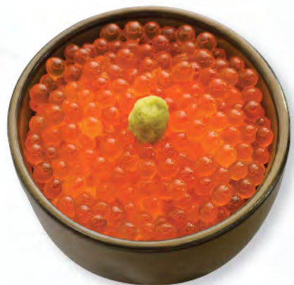
日本産イクラ井 日本三文魚籽飯 Japanese Salmon Roe Donburi