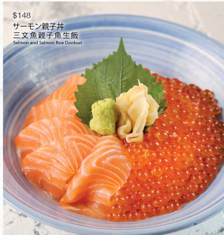
$148 サーモン親子丼 三文魚親子魚生飯 Salmon and Salmon Roe Donburi