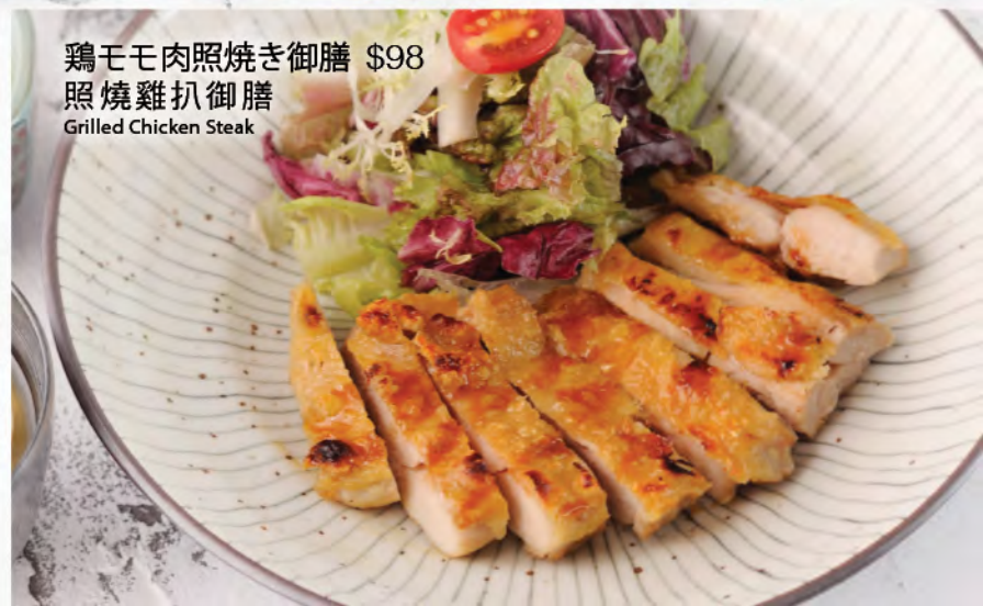
鶏モモ肉照焼き御膳 $98 照焼雞扒御膳 Grilled Chicken Steak