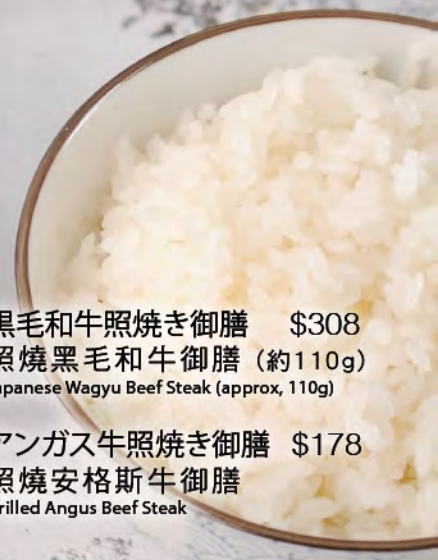
アンガス牛照焼き御膳 $178 照焼安格斯牛御膳 Grilled Angus Beef Steak