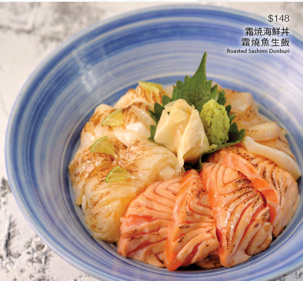
$148 霜焼海鮮丼 霜焼魚生飯 Roasted Sashimi Donburi