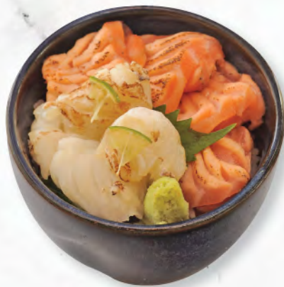
焼霜海鮮丼 霜焼魚生飯 Flamed Sashimi Donburi