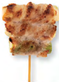
アスパラの 豚肉巻き 日本黒豚露筍 Japanese Pork with Asparagus