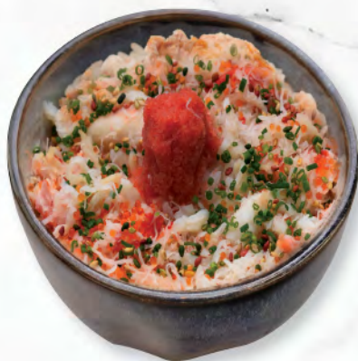
明太子カニ丼 明太子蟹肉飯 Cod Roe & Crab Meat Donburi