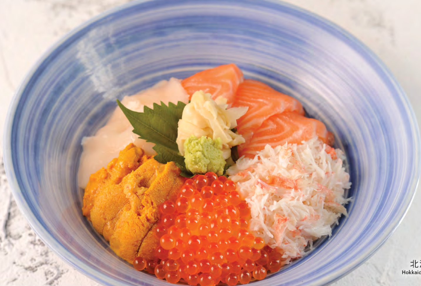
$178 北海丼 北海道刺身飯 Hokkaido Sashimi Donburi