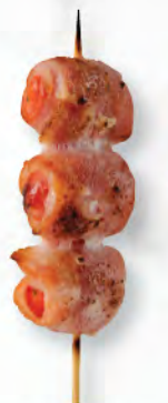
トマトの ベーコン巻き 煙肉番茄卷 Bacon with Cherry Tomato